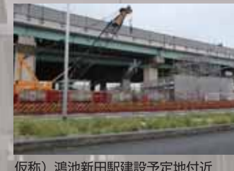
(仮称) 鴻池新田駅建設予定地付近 JR 学研都市線の鴻池新田までは 400 ～ 500 メートルあるので接続が課題