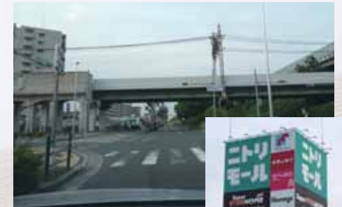
(仮称) 瓜生堂駅建設予定地、近鉄も瓜生堂駅を新設予定