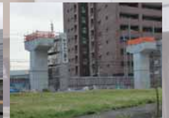
中央環状線を離れて荒本駅に向かう区間の軌道桁工事現場