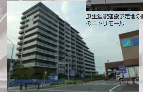
瓜生堂駅建設予定地の前のニトリモール