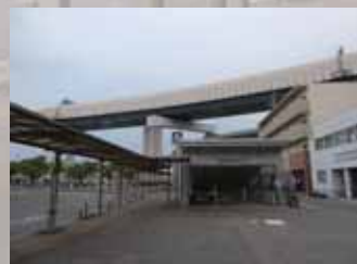
大阪メトロ長堀鶴見緑地線 門真南駅 門真南～鴻池新田間の軌道桁工事現場