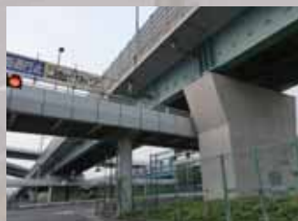
(仮称) 門真南駅は門真ジャンクションに建設予定