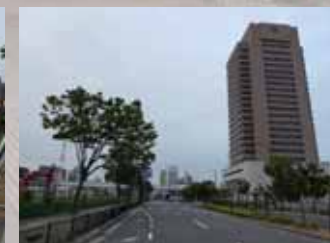
東大阪市の役所の向かいが荒本駅建設予定地