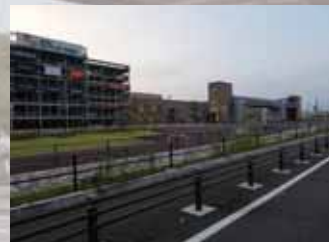
(仮称) 松生町駅建設予定地 商業施設のすぐ横