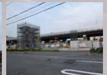
荒本～瓜生堂間の軌道桁工事現場 (中央環状線沿いに戻る)