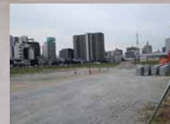
(仮称) 荒本駅建設予定地 (イオンモール跡地)