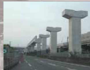
松生町～門真南間の軌道桁工事現場