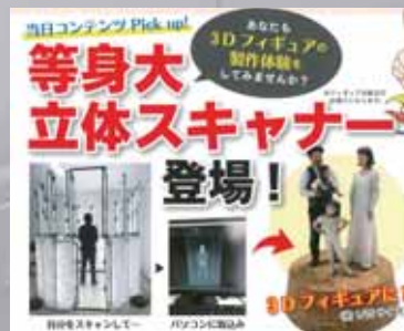
等身大スキャナ→フィギュア作成