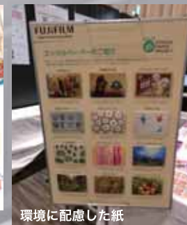
環境に配慮した紙