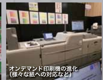
オンデマンド印刷機の進化 (様々な紙への対応など)