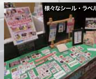
様々なシール・ラベル