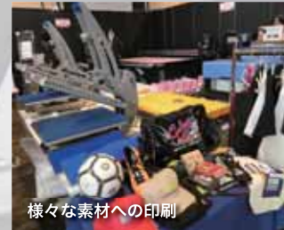
様々な素材への印刷