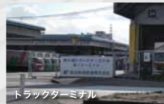
トラックターミナル