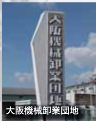
大阪機械卸業団地