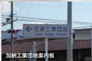
加納工業団地案内板