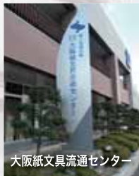
大阪紙文具流通センター