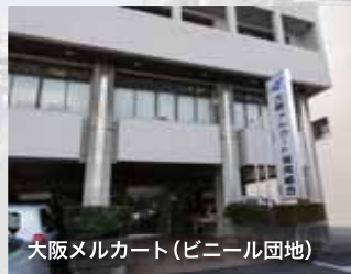
大阪メルカート(ビニール団地)