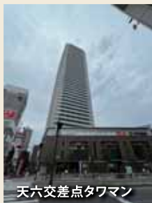
天六交差点タワマン