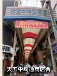
天五中崎通商店街