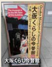
大阪くらしの今昔館