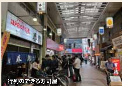
行列のできる寿司屋