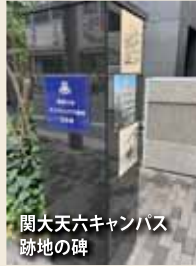
関大天六キャンパス跡地の碑