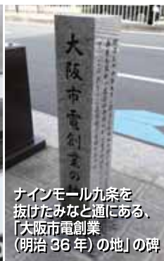
サインモール九条を抜けたみなと通にある、「大阪市電創業(明治36年)の地」の碑