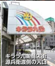
キララ九条商店街 源兵衛渡側の入口