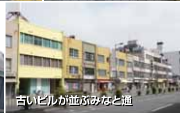
古いビルが並びみなと通