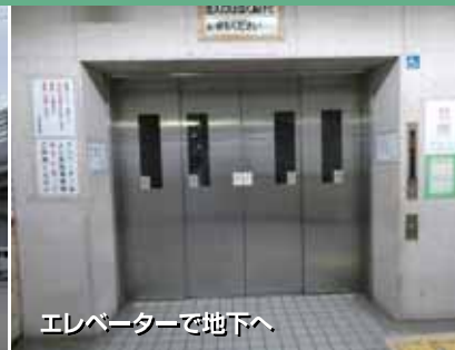
エレベーターで地下へ