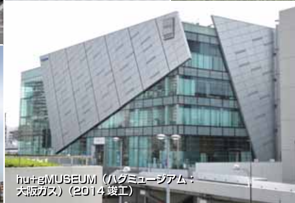
hufgMUSEUM(ハグミュージアム:大阪ガス)(2014竣工)