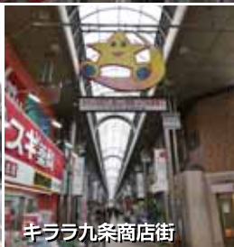
キララ九条商店街