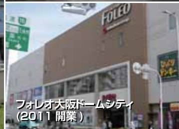
フォレオ大阪ドームシティ(2011開業)