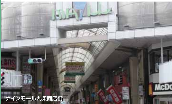
サインモール九条商店街