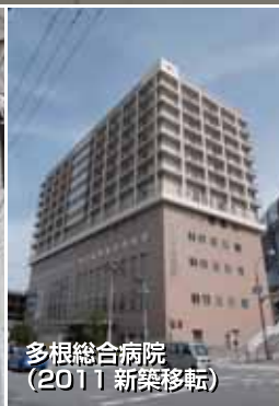
多根総合病院(2011新築移転)