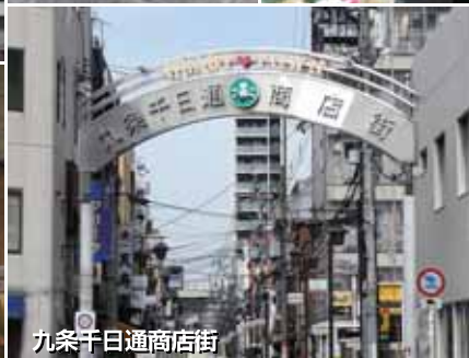
九条千日通商店街