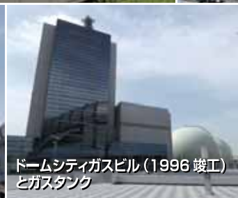
ドームシティガスビル(1996竣工)とガスタンク