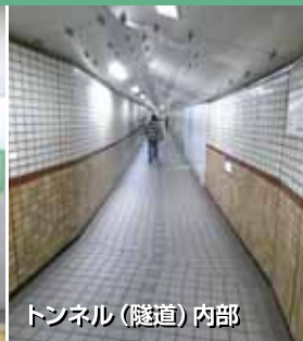
トンネル(隧道)内部