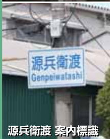
源兵衛渡 案内標識