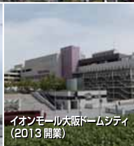
イオンモール大阪ドームシティ(2013開業)