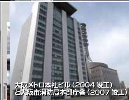
大阪メトロ本社ビル(2004竣工)と大阪市消防局本部庁舎(2007竣工)