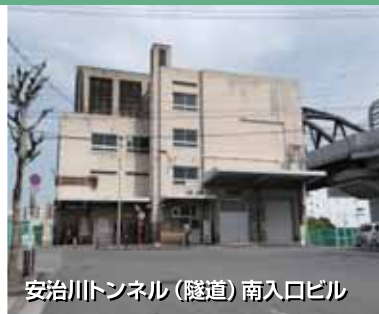
安治川トンネル(隧道)南入口ビル

一方、平成に入ってから、大阪ドームが開業(平成18年)し、その後周辺にショッピングモールなども開業し、新しい街を形成しました。(九条南～千代崎エリア)週末になると家族連れや若い世代で賑わっています。