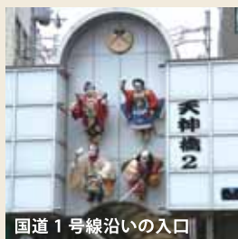
国道1号線沿いの入口

まずは言わずと知れた天神橋筋商店街。地元民以外も多く訪れ、集客力は別格です。天神橋一丁目から七丁目まで続き、その長さは南北およそ2.6km。地下鉄の駅3つにまたがっており、「日本一長い商店街」として知られています。1653年からある歴史ある商店街で、商店街の端には大阪天満宮があります。あらゆる種類の飲食店がありますが、入れ替わりは激しく、激戦区になっています。それでも、店が撤退するとすぐ別の店が入るようです。