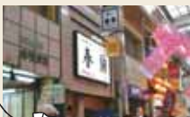
行列ができる寿司屋