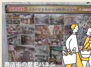
商店街の歴史パネル