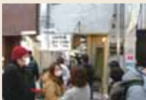
大行列のコロッケ屋