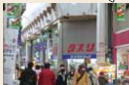
日本初のスーパー、ダイエー発祥の地はこのあたり