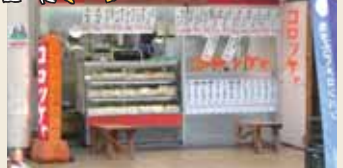
昔ながらのコロッケ屋

千林商店街は100年以上の歴史があり、昭和32年に日本初のショッピングセンターが開店した場所としても知られています。商店街があるのは、京阪電鉄の千林駅から大阪メトロの千林大宮駅まで。その長さは約660m、更に本通りから枝分かれした商店街も広がっています。下町風情が残る場所にアーケード街があり、AエリアからEエリアまで5エリアに分かれています。スーパーよりも安い、元気な八百屋さんや中高年向けの衣料品店、美味しそうなお惣菜店など、魅力のある店も多く、活気があり人通りも多い商店街です。