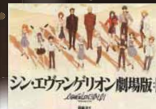
シン・エヴァンゲリオン劇場版