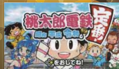
桃太郎電鉄〜昭和 平成 令和も定番!〜