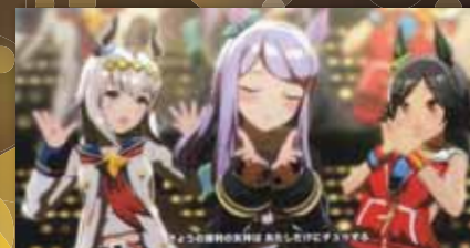
ウマ娘 プリティーダービー