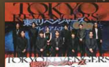
東京リベンジャーズ