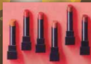
ケイトリップモンスター