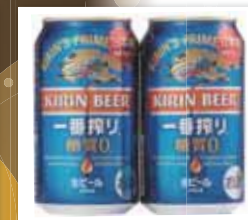
キリン一番搾り 糖質ゼロ