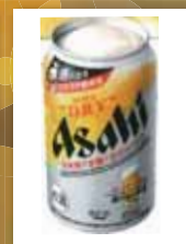
アサヒスーパードライ 生ジョッキ缶