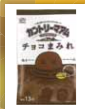
カントリーマアム チョコまみれ