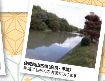
佐紀陵山古墳(奈良・平城) 平城にも多くの古墳があります