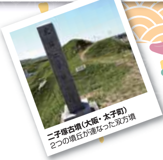
二子塚古墳(大阪・太子町) 2つの墳丘が重なった双方墳