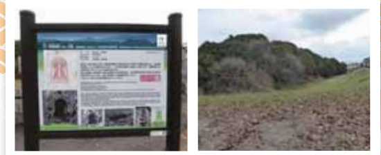
仲津山古墳(古市古墳群) すぐ横は住宅地、世界文化遺産登録で案内板は整備されています