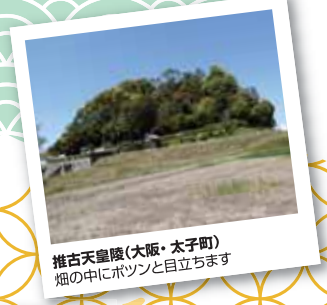
推古天皇陵(大阪・太子町) 畑の中にポツンと目立ちます