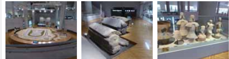
大阪府立近つ飛鳥博物館(大阪・河南町) 古墳のことが詳しくわかります