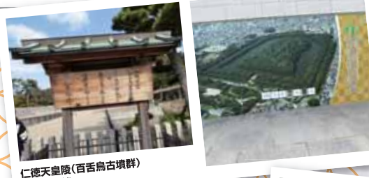
仁徳天皇陵(百舌鳥古墳群) 最大の古墳