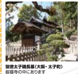
聖徳太子磯長墓(大阪・太子町) 叡福寺の中にあります