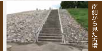
南側から見た古墳