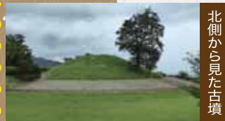
北側から見た古墳

5世紀前半につくられた中・北河内最大の前方後円墳で、この地域一帯を治めた豪族の墓と考えられています。墳丘長は約160mあり、総面積は30,000㎡です。埋葬施設は後円部に3基の粘土槨(ねんどかく)に納められた木棺があり、甲冑(かっちゅう)・き鳳鏡・刀剣類などの副葬品が出土しています。この古墳の東側には、西ノ山古墳や花園山古墳など、心合寺山古墳よりも古い4世紀代の前方後円墳があり、総称して「楽音寺・大竹古墳群」と呼んでいます。隣に「しおんじやま古墳学習館」があり、古墳の解説やグッズ販売もされています。