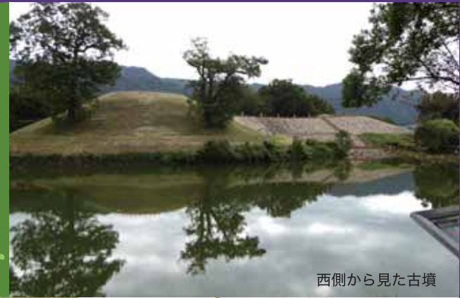
西側から見た古墳

今月は久しぶりに地元探訪です。 弊社のある東大阪市の南隣、八尾市の北東部、 生駒山地の麓に位置する玉祖神社と心合寺山古墳です。