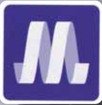
大阪メトロ マーク