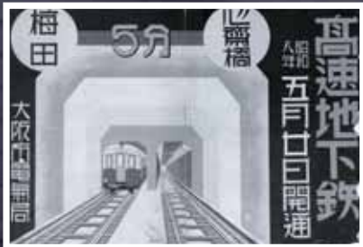
開通時のポスター

御堂筋線心齋橋駅から長堀鶴見緑地線心齋橋駅への連絡路にある「心齋橋」のレリーフ。心齋橋が架かっていた長堀川は埋め立てられ、そこに長堀鶴見緑地線が走っていることにちなんでいます。