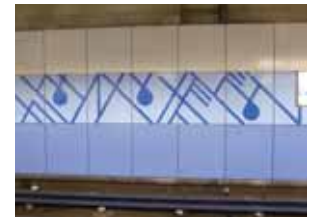
▲「かみつなぎばし」の隠し文字(斜めにすると読めます)他の3つもホームにあります

*1,300両以上の車両を有する大阪メトロは各地に検車場・車庫を持っていますが、長堀鶴見緑地線・今里線の車両の検車場は、鶴見緑地公園の下にあり、地上はテニスコートになっているため、あまり知られていません。