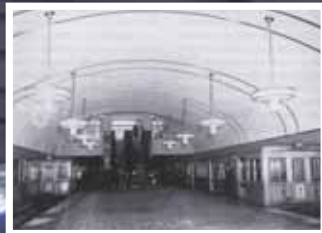
開業間もない頃の心齋橋駅