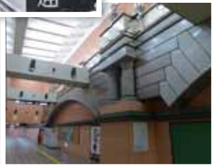
今の心齋橋駅 高さのあるアーチ式天井は変わらず

御堂筋線心齋橋駅から長堀鶴見緑地線心齋橋駅への連絡路にある「心齋橋」のレリーフ。心齋橋が架かっていた長堀川は埋め立てられ、そこに長堀鶴見緑地線が走っていることにちなんでいます。