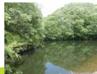
ハイキングコース風景