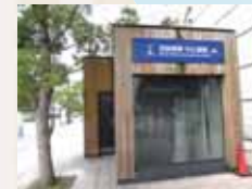
連絡する線がなく孤立している京阪中之島駅