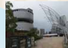
大阪市立科学館（左）と国立国際美術館（右）