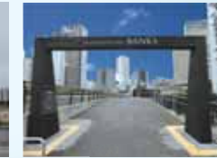
川沿いの商業施設中之島BANKS