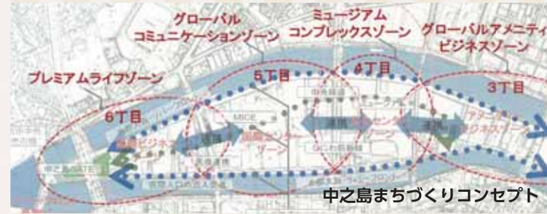
中之島まちづくりコンセプト