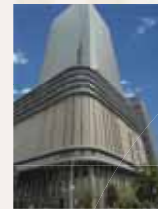
フェスティバルタワー：フェスティバルホール・オフィス