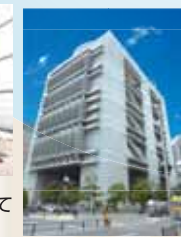
大阪府立国際会議場 世界標準のMICE(*1)と比べると小規模で中途半端な施設

夢洲へのIR誘致の行方、リーガロイヤルホテルの建替え計画など未決定要素もあり、また労働力不足という国家的課題にも直面していかなければなりません、今の小学生が大人になるころには、「中之島」がキタ、ミナミに次ぐ一大拠点になっているかもしれません。