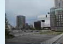
北側の市有地 新美術館・再生医療の国際拠点建設を計画予定