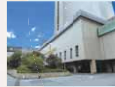
インバウンド需要が好調で建替えを延期した築50年のリーガロイヤルホテル